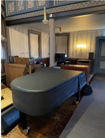
Musikk/organistdel av kirken.